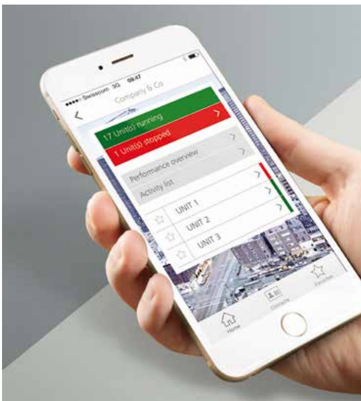
Prístup z inteligentného telefónu prostredníctvom aplikácie