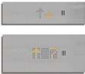
Botonera de cabina ▶▶