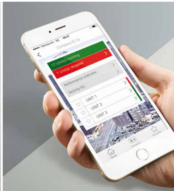
Accès à partir d'un Smartphone via l'application dédiée