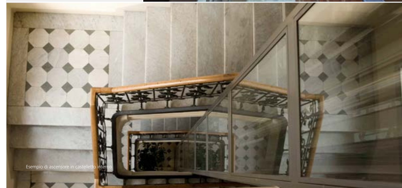
Esempio di ascensore in castelletto interno