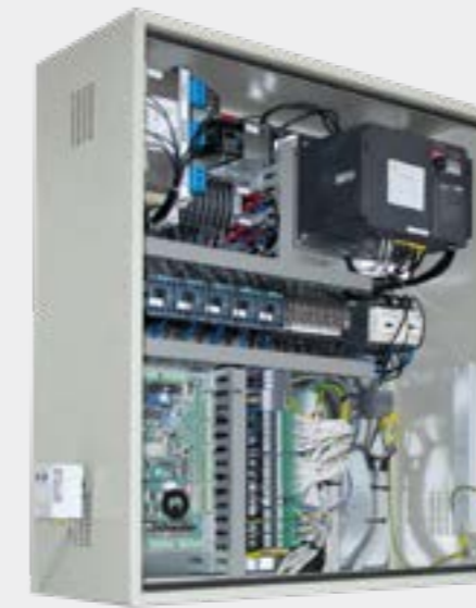
Nuovo quadro di manovra

Messaggio con finalità promozionale. Per l'esempio riferito all'offerta, visita il sito schindler.it > Modernizzazioni > Finanziamento. Fac simile del contratto di finanziamento, fogli informativi e informazioni precontrattuali disponibili sul sito web di Sella Personal Credit S.p.A. (Gruppo Banca Sella) sellapersonalcredit.it nella sezione Trasparenza > Prestiti finalizzati . Salvo approvazione della società finanziaria convenzionata con Schindler S.p.A. Per durate del finanziamento superiori ai 36 mesi, consultare il referente commerciale Schindler.