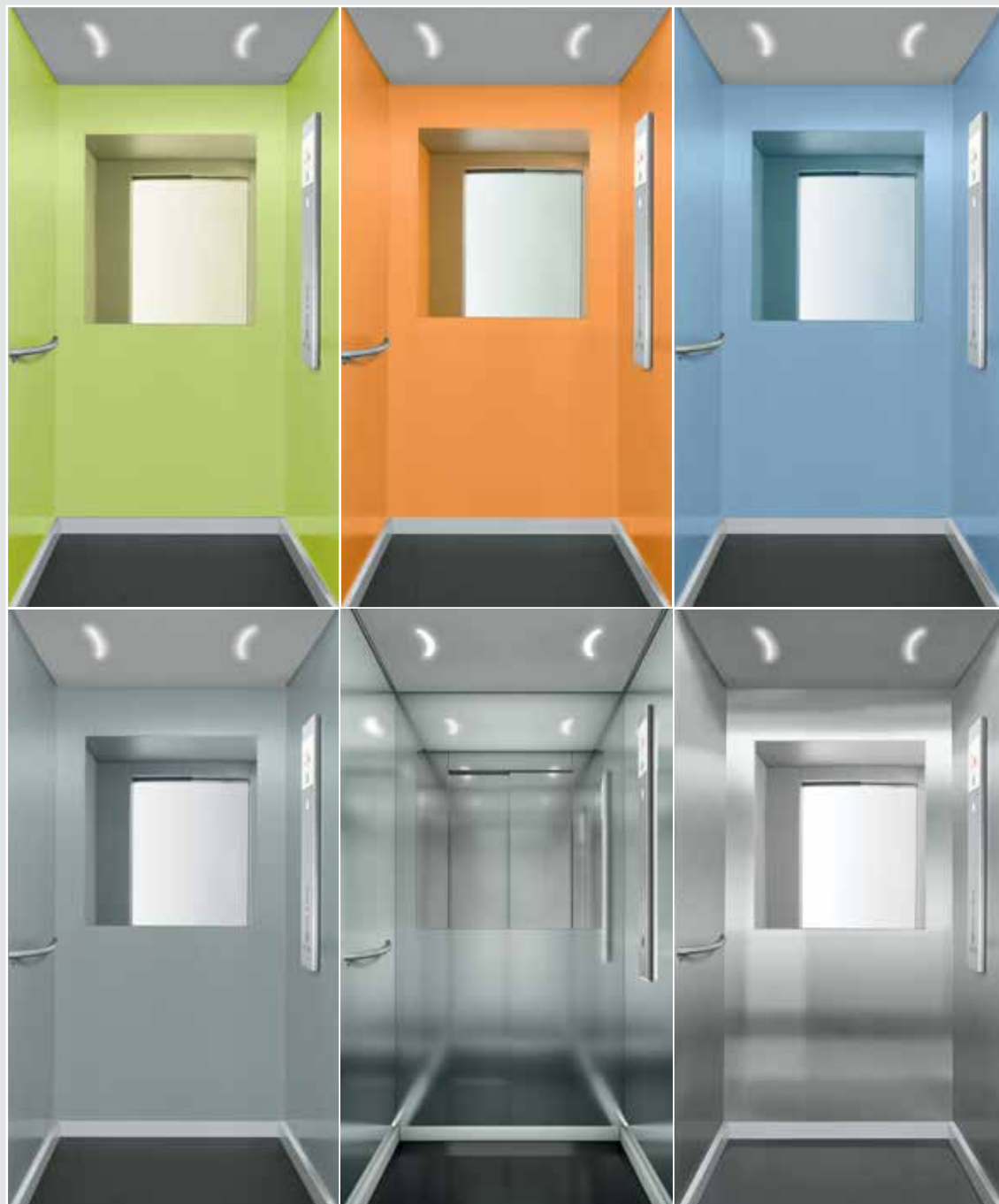
Cabines stratifiées et inox 3100S

La qualité Schindler n'a jamais été aussi accessible.