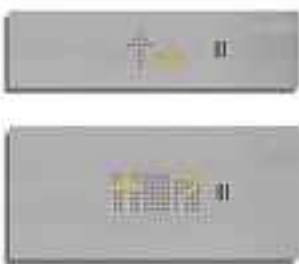
Betjeningspanel i kabinen ▶▶