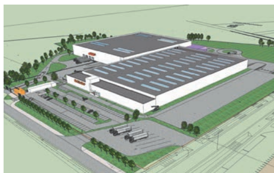
Dunajská Streda, Slowakei 149 000 m 2 Fahrtreppenfabrik Aufzugsfabrik Logistikzentrum