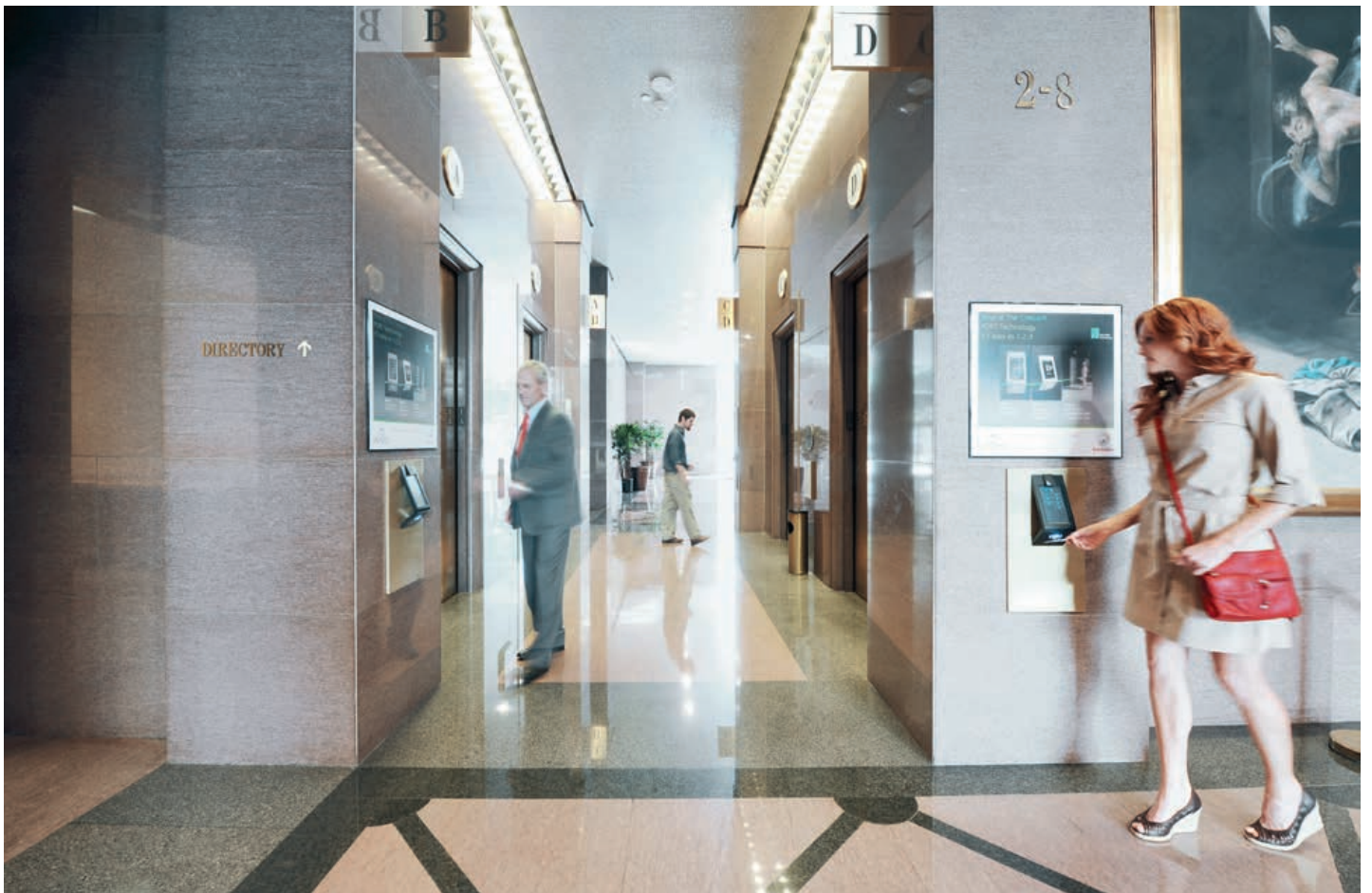
PORT-Technologie, eine hoch individualisierte Dienstleistung, welche den Verkehrsfluss im Gebäude optimiert und Energie einspart.