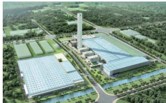
Schanghai, China 315 000 m 2 Fahrtreppenfabrik Aufzugsfabrik Forschungs- und Entwicklungszentrum Zentrale für China und Asien/Pazifik