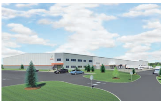
Hanover, USA 14 000 m 2 Aufzugsfabrik Logistikzentrum