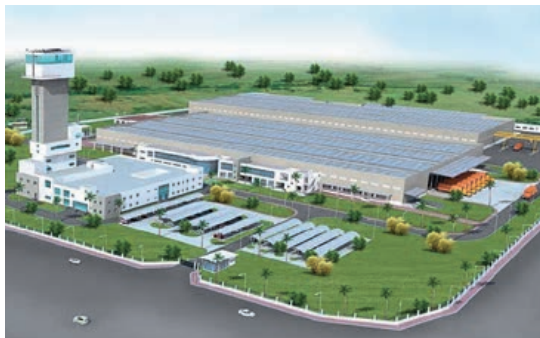
Pune, Indien 200 000 m 2 Fahrtreppenfabrik Aufzugsfabrik Forschungs- und Entwicklungszentrum