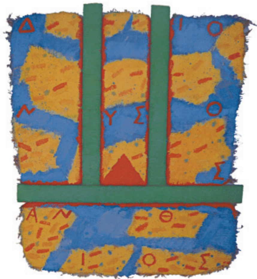
Dionysos Anthios C (1988) Künstler: Joe Tilson Galerie: Theo Waddington Fine Art Ltd., London