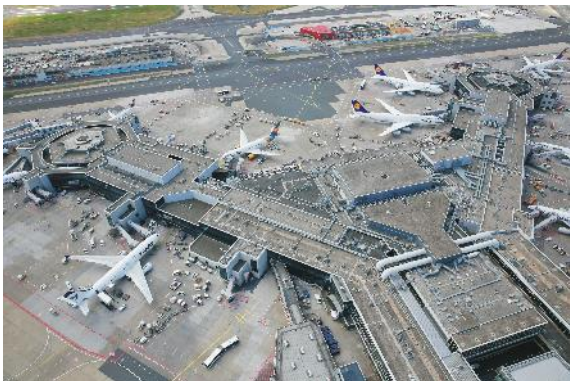
Das künftige Terminal 3 wird auch Gate-Positionen für Großraumflugzeuge haben.

Text und Bilder stehen für Sie unter www.schindler.de im Bereich Presse zur Verfügung.