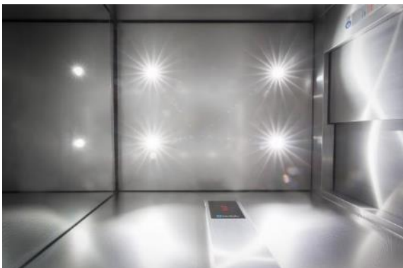
Haushahn-Aufzüge verbinden modernste Technik mit anspruchsvollem Design.