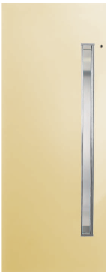
Acabamento em aço carbono e pintura na cor areia. Puxador em aço inoxidável.