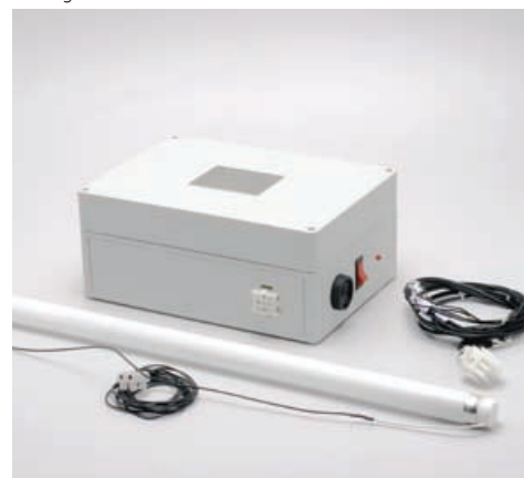
Kit Luz de Emergência composto por fonte, fiação e lâmpada fluorescente.