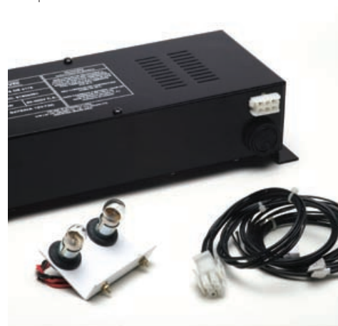
Kit Luz de Emergência composto por fonte, fiação e lâmpadas 12v.