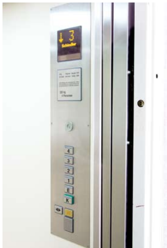
Kabinentableau FI MXB, je nach Modernisierungsumfang