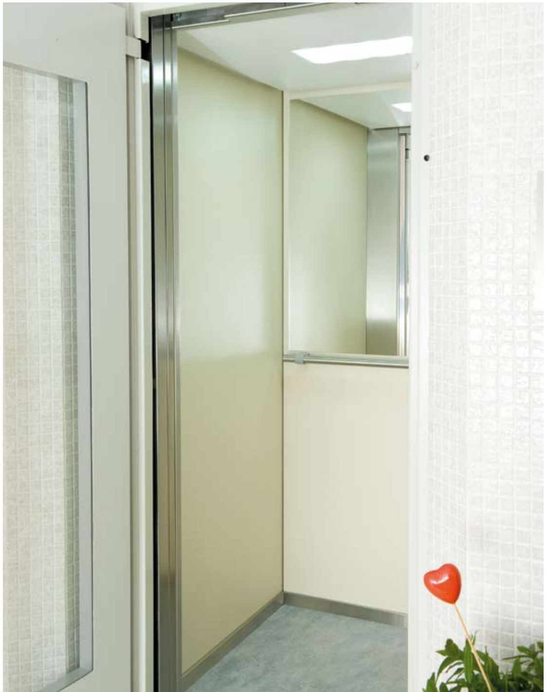
Wand hellbeige, Boden grau, Spiegel, Handlauf, Sockelleiste