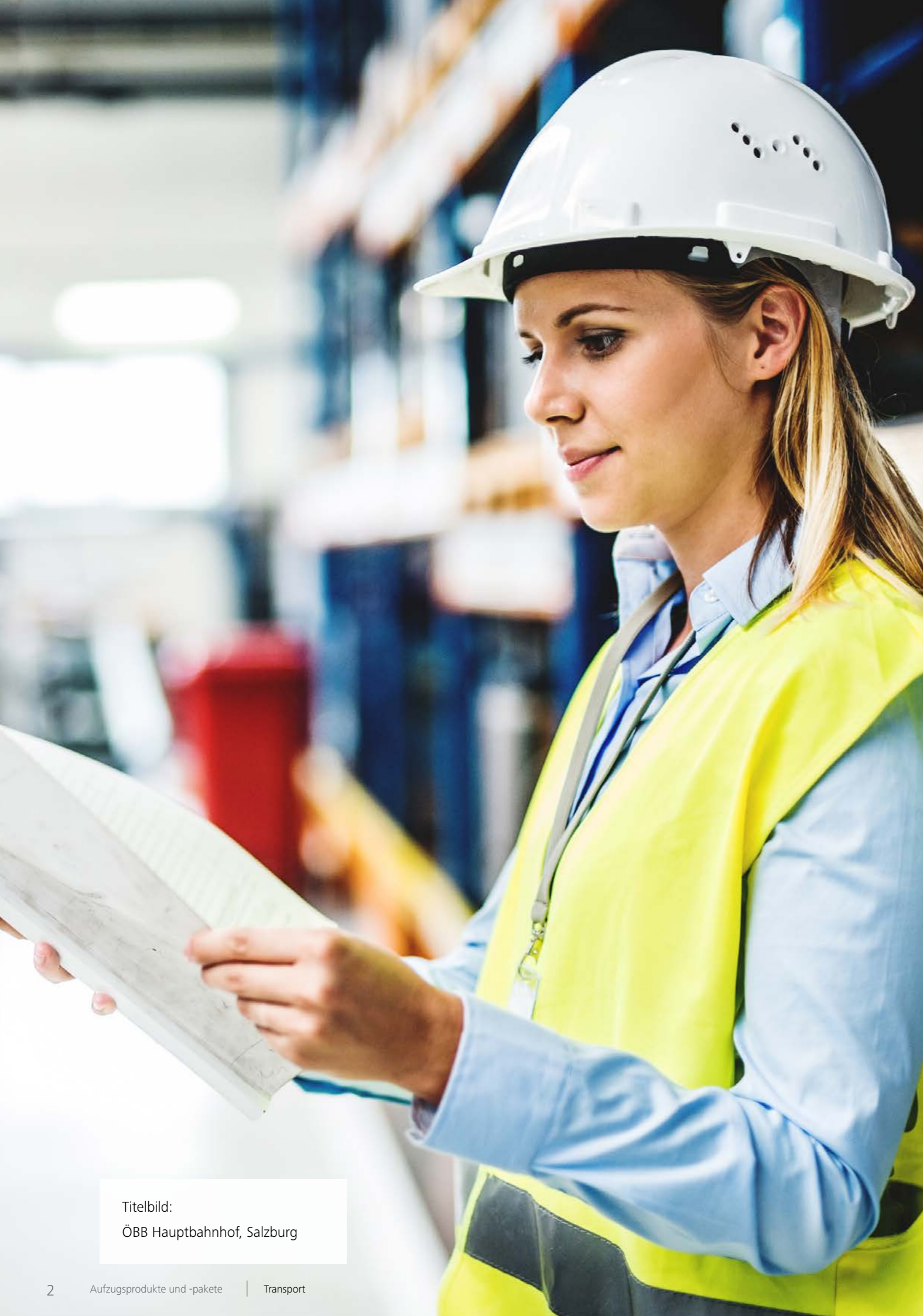
Titelbild: ÖBB Hauptbahnhof, Salzburg