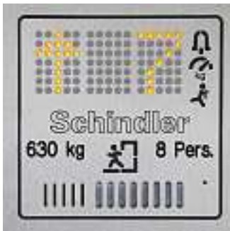
Digitaler Anzeiger im Kabinentableau